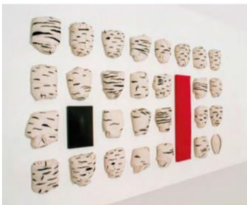
Cesare Berlingeri - Ventotto avvolti tra nero e rosso 2008, tecnica mista su tela piegata, 337x193 cm.

La retrospettiva propone un ampio confronto tra le opere recenti e i lavori storici di Berlingeri, come quelli caratterizzate dal colore blu oltremare degli anni ottanta , che hanno contraddistinto il suo cammino artistico internazionale. Il curatore spiega in maniera esemplare il lavoro del grande artista calabrese: “Berlingeri si proietta su ciò che deve ancora accadere. Ne scaturisce un’evoluzione artistica costante dove nulla è mai uguale a se stesso e anche se lo fosse la nostra intelligenza emotiva non lo riconoscerebbe a distanza di tempo perché essa stessa è trasformata. Tutto risponde a un’effimera matrice che si sintetizza in una o più azioni, piegature, avvolgimenti, installazioni più cerebrali che fisiche, legate a forme che esaltano maggiormente la concezione ciclica del tempo che non lo spazio” .