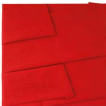
Cesare Berlingeri - Avvolto rosso 2016, olio e pigmento su tela piegata 153,5x154 cm. Courtesy private collection Milano. Ph. Giovanni Fava

ca un omaggio al passato e non vuole certo sfidare i grandi nomi che l'hanno preceduto. Piuttosto è come se volesse completare lo spazio con un colloquio con il tempo, con forme che cercano una connessione con l'essenza delle opere presenti, attraverso un “effimero sospeso” che permette al visitatore di vivere la collezione attraverso ottiche inedite”.