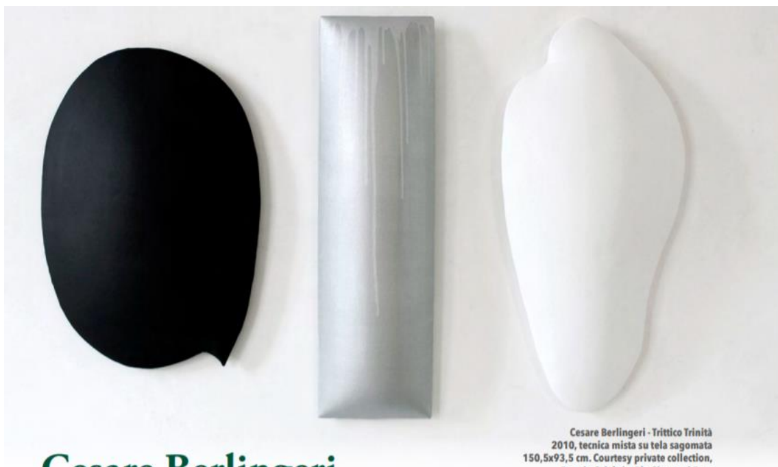
Cesare Berlingeri - Tritico Trinità 2010, tecnica mista su tela sagomata 150,5x93,5 cm. Courtesy private collection, Reggio Calabria. Ph. Giovanni Fava