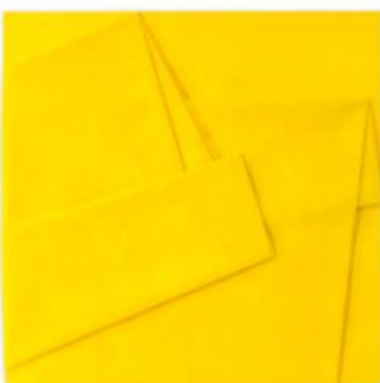
Cesare Berlingeri - Troppa luce per Vincent 2018, olio e pigmento su tela piegata 151,5x150,5 cm.