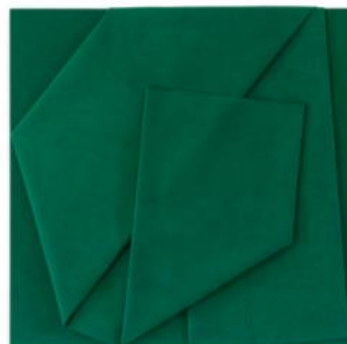
Cesare Berlingeri - Sul verde piegato 2016, olio e pigmento su tela piegata 150x151,5 cm.