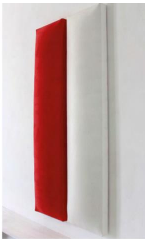
Cesare Berlingeri - Dittico bianco e rosso, 2008, tecnica mista su tela sagomata, 65x133,5 cm.